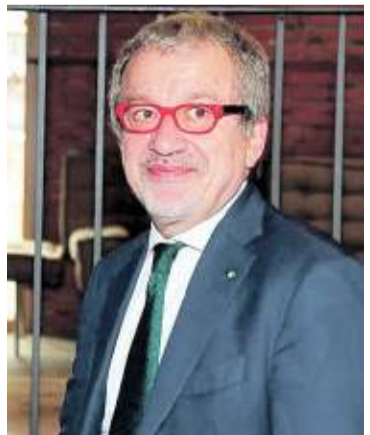
Roberto Maroni

IL GOVERNATORE: L'HO INCONTRATO IO A GENNAIO I SEGNALI DI SALVINI: BENE SE ARRIVA ANCHE GRILLO